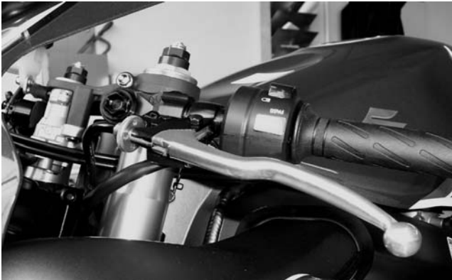
Abb.3 / pic. 3

Lenkerarmaturen aufsetzen und Lenkrohr mit Dreharm verschrauben. Lenkerklammung bündig an oberer Gabelbrücke ausrichten und festziehen. Beide Lenkrohre müssen gleich ausgerichtet sein. Bei vollem Lenkeinschlag müssen Lenker, Armaturen, Züge und Leitungen frei beweglich sein. Hebel und Armaturen festschrauben, Griffgummi links verkleben.