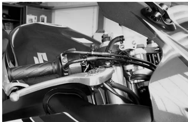
Abb.4 / pic. 4

Original-Bremsschlauch (Zulauf) gegen mitgelieferten Schlauch ersetzen. Bremsflüssigkeitsbehälter mit Schraube M6x16 an Halter H01 montieren und an Gabelklammung rechts befestigen. Anschließend Bremssystem entlüften. Verschlussstopfen in Lenkerenden einsetzen.