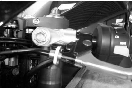
Abb.3 / pic. 3

Lenkarmaturen aufsetzen und Lenkrohr mit Dreharm verschrauben. Lenkerklammung bündig an oberer Gabelbrücke ausrichten und festziehen. Beide Lenkrohre müssen gleich ausgerichtet sein. Hebel und Armaturen festschrauben, Griffgummi links verkleben.