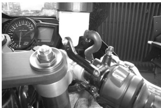
Abb.4 / pic. 4

Bremsflüssigkeitsbehälter mit Halter HA12 und Schraube M6x 30 an Aufnahme montieren und ausrichten.